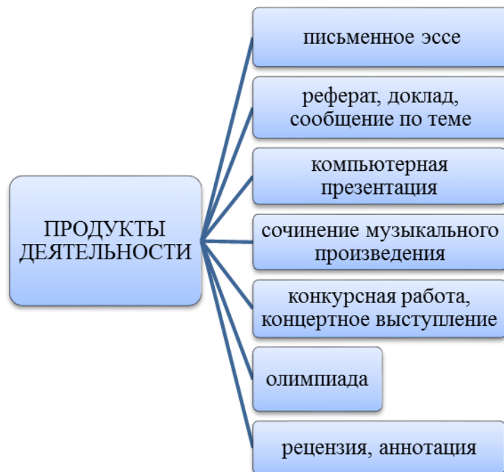
Рис. 3. Выделяемые виды продуктов деятельности в музыкальном образовании Fig. 3. Kinds of activity products in music education