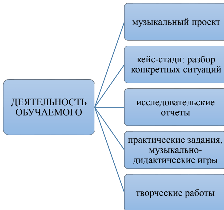
Рис. 4. Основные виды деятельности обучающегося в музыкальном образовании Fig. 4. The main activities of the student in music education