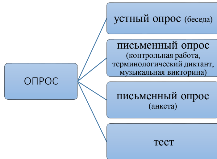
Рис. 2. Выделяемые виды опроса в музыкальном образовании Fig. 2. Types of survey distinguished in music education