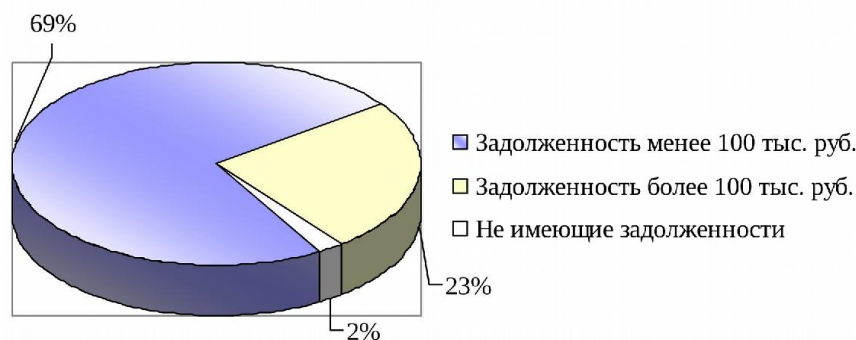
Рис. 4. Сегментация по дебиторской задолженности, % Fig. 4. Segmentation by the receivable, %

Основными направлениями коммерческой деятельности оптовой компании ООО «ЛинГранд» по продвижению товаров на рынок являются стимулирование сбыта и личные продажи. Стимулирование сбыта осуществляется за счет стимулирования посредников и стимулирования собственного сбытового персонала. В качестве основных методов стимулирования посредников оптовая компания использует: