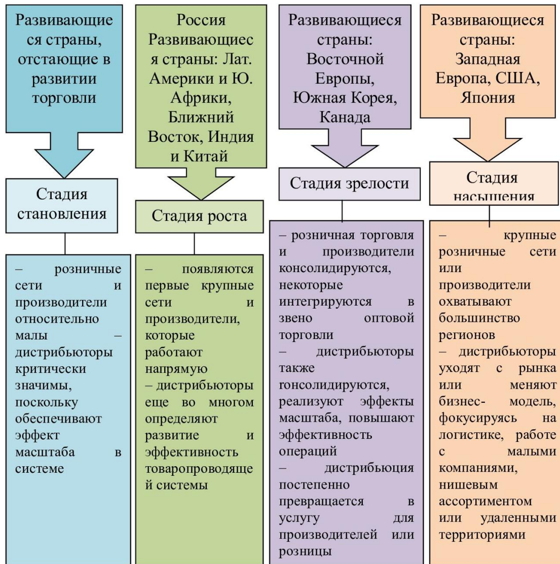
Рис. 1. Этапы развития оптовой торговли Fig. 1. Stages of development of wholesale trade

оптовой торговли изменяется под воздействием общерыночных тенденций, при этом проходит несколько стадий развития. В настоящее время российский сектор оптовой торговли также как и розница находится на стадии роста (рис. 1).