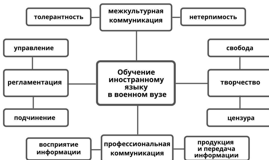
Рис. 2 Противоречия обучения иностранному языку в военном вузе Fig. 2 Contradictions of the foreign language teaching in a military tertiary institution

любая педагогическая деятельность является созданием нового ввиду пластичности человеческого мышления (рис. 2).