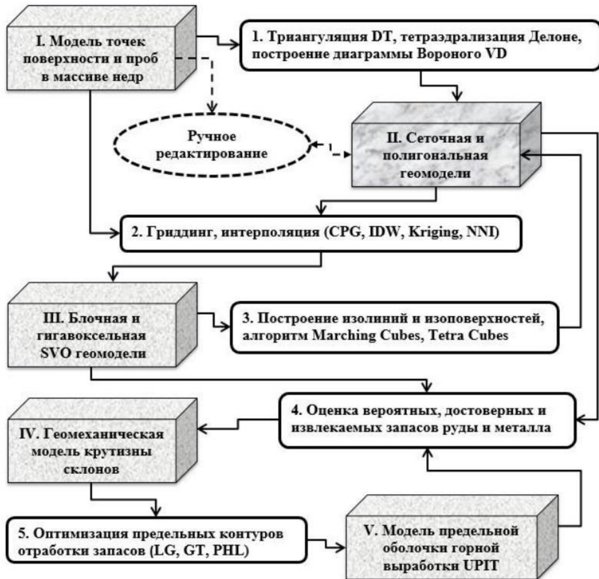
Рис. 1. Общая схема основных моделей и методов оценки извлекаемых запасов руды Fig. 1. General scheme of the basic models and evaluation methods recoverable ore

На рис. 2 показаны результаты тестирования при проведении расчетов на стандартной базе геоданных точек месторождения ABC.