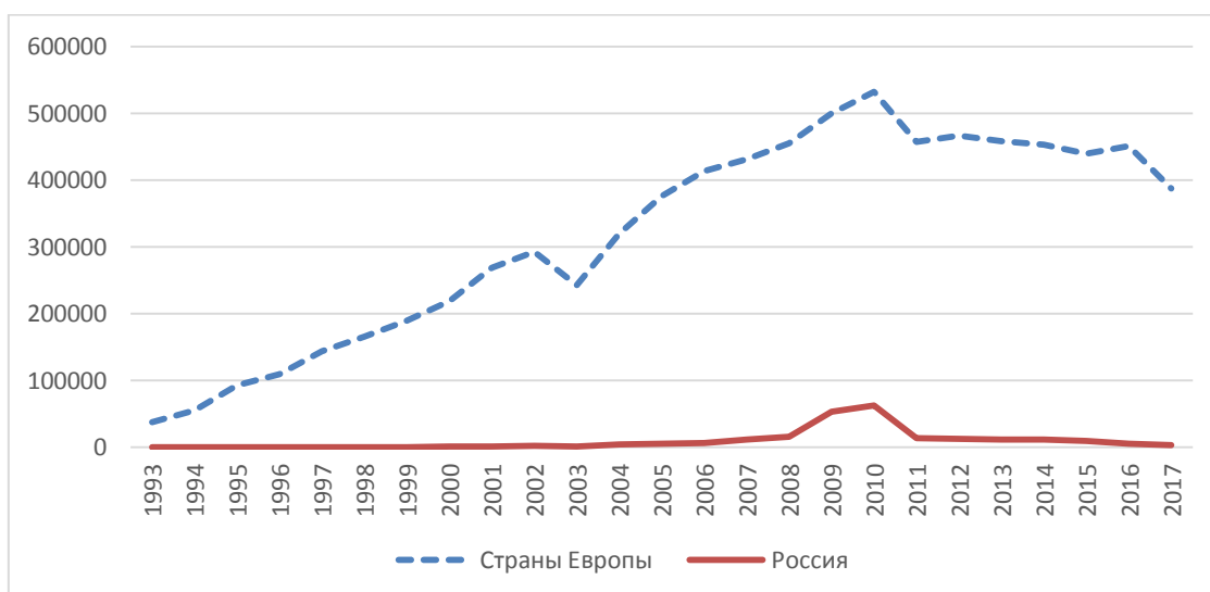
Рис. 1. Количество предприятий в России и Европе, сертифицированных по стандарту ISO 9001 на конец 2017 г.

Международная организация по стандартизации (ISO — International Organization for Standardization) проводит ежегодное исследование результатов применения стандарта ISO 9001 по всему миру «The ISO Survey». Согласно статистике, на конец 2017 года количество выданных сертификатов в России составляло 0,3% от общемирового, или 0,9% от сертификатов, выданных в Европе. Безусловно, это крайне низкий показатель.