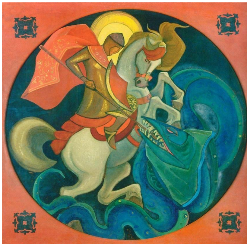
Рис. 2. Н.К. Рерих. Свет побеждает тьму. 1933. Холст, темпера. 74,5 × 74,5. Собрание Аллахабадского муниципального музея (Аллахабад, Индия) Fig. 2. Nicholas Roerich. Light Conquers Darkness. 1933. Canvas, tempera. 74.5 × 74.5. Collection of Allahabad Museum (Allahabad, India)