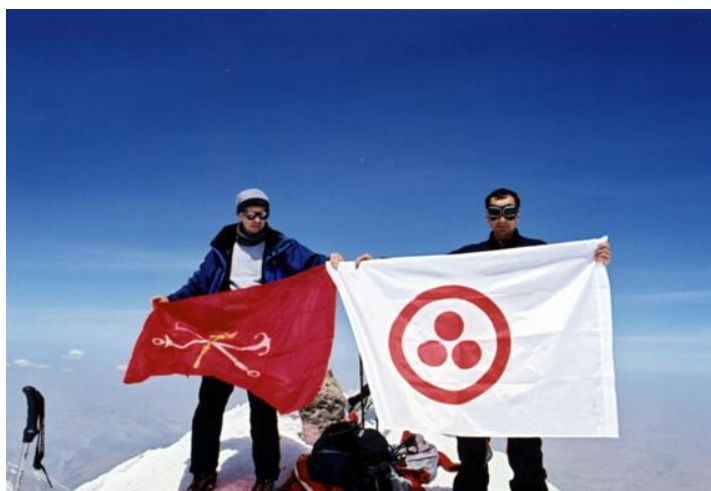
Рис. 3. Знамя Санкт-Петербурга и Знамя Мира на Вершине Эльбруса. 11 мая 2003 г.

этим он объединяет их как символ Культуры вообще. Культурные акции, проводимые в регионе под знаком Знамени Мира, свидетельствуют о значимости идей Н.К. Рериха и его Пакта о защите культурных ценностей.